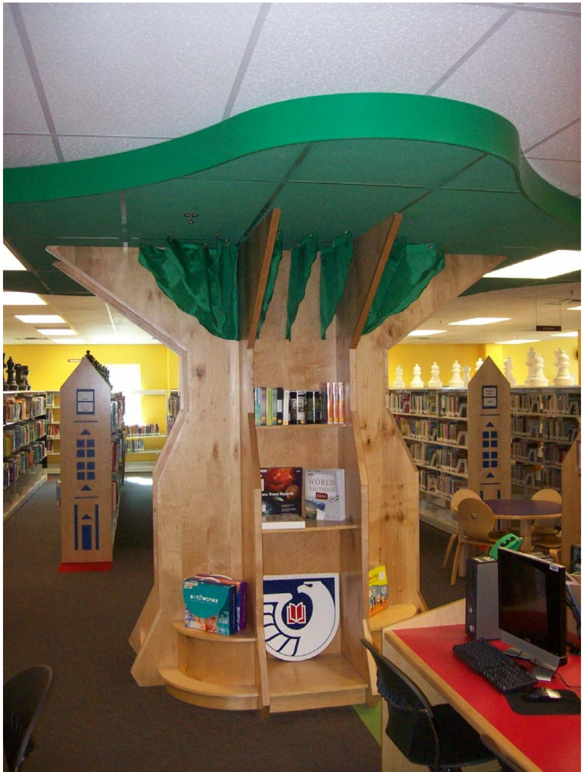
在 E1 Paso 公共图书馆主图书馆儿童部的政府资料「树」