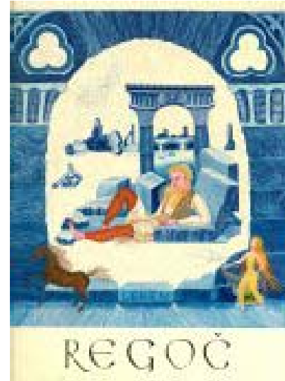
يصور هذان الكتابان صراع الخير والشر

تطور إنتاج الكتب المصورة في كرواتيا في عصور ما بعد الحرب، مُتَّبعة الاتجاهات العالمية مُقدمة محتويات مختلفة: أغاني وقصص تتبع سجع وأمثال وألغاز وقصص عن بعض الأحداث والحيوانات والبيئة وقصص بها مشاكل وعن الحياة وأخرى خيالية وأساطير.